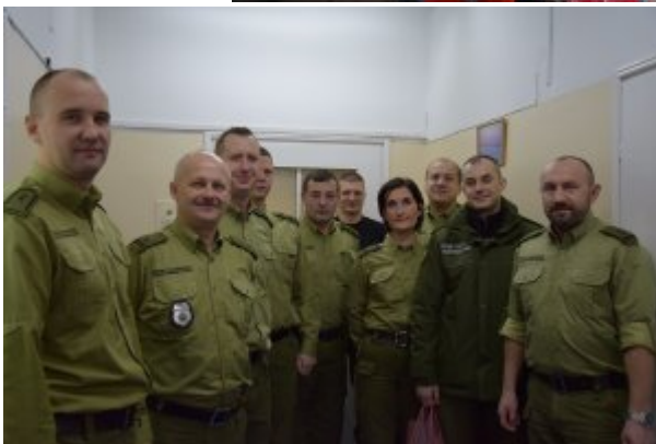
Funkcjonariusze oddający krew