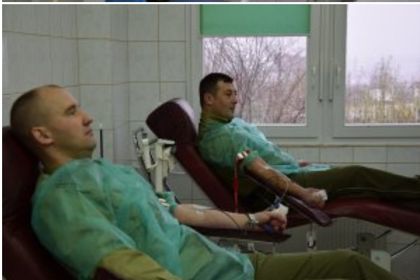
Funkcjonariusze oddający krew