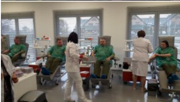
Funkcjonariusze oddający krew