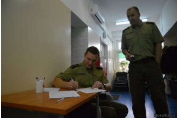
Funkcjonariusze oddający krew