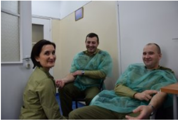
Funkcjonariusze oddający krew