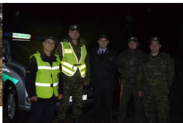
Udział funkcjonariuszy Podlaskiego OSG w misjach poza granicami kraju