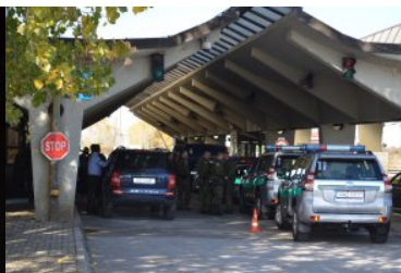
Udział funkcjonariuszy Podlaskiego OSG w misjach poza granicami kraju