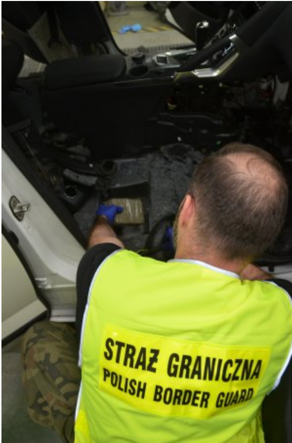
Rekordowy przemyt haszyszu