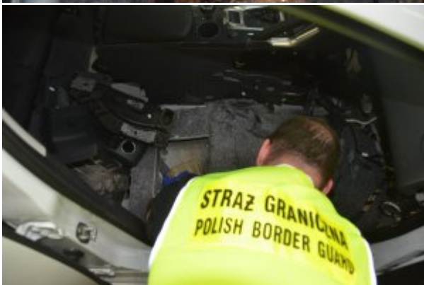
Rekordowy przemyt haszyszu