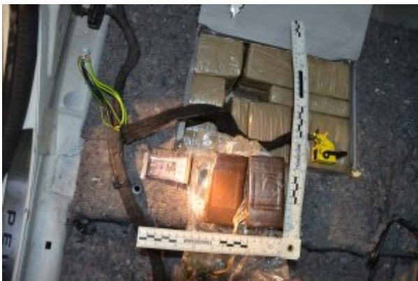
Rekordowy przemyt haszyszu