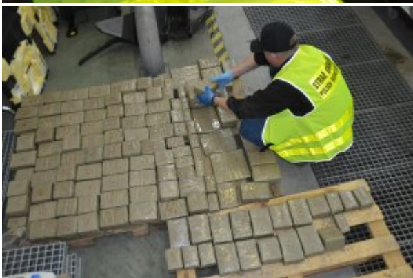
Rekordowy przemyt haszyszu