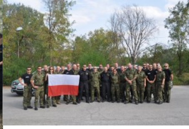
8. edycja operacji w Macedonii