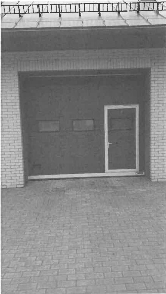
zdjęcie nr 1