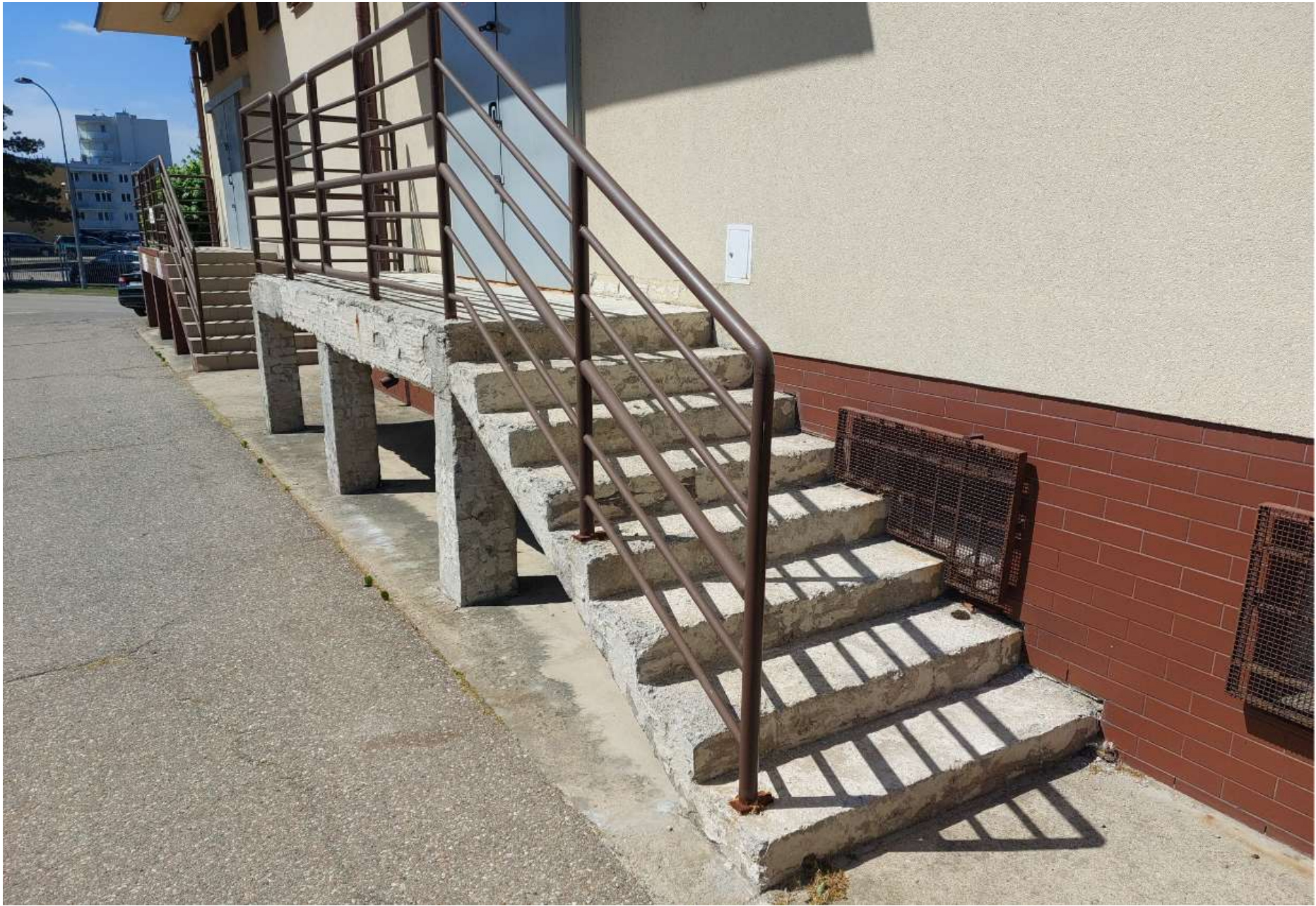
Zdjęcie nr 4: Rampa rozładunkowa i schody nr 2 (stan istniejący) – widok na schody