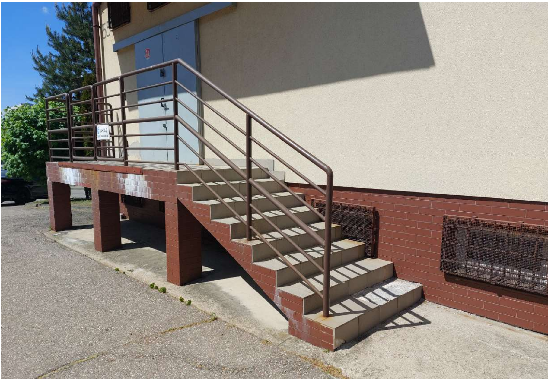
Zdjęcie nr 2: Rampa rozładunkowa i schody nr 1 (stan istniejący) – widok na schody