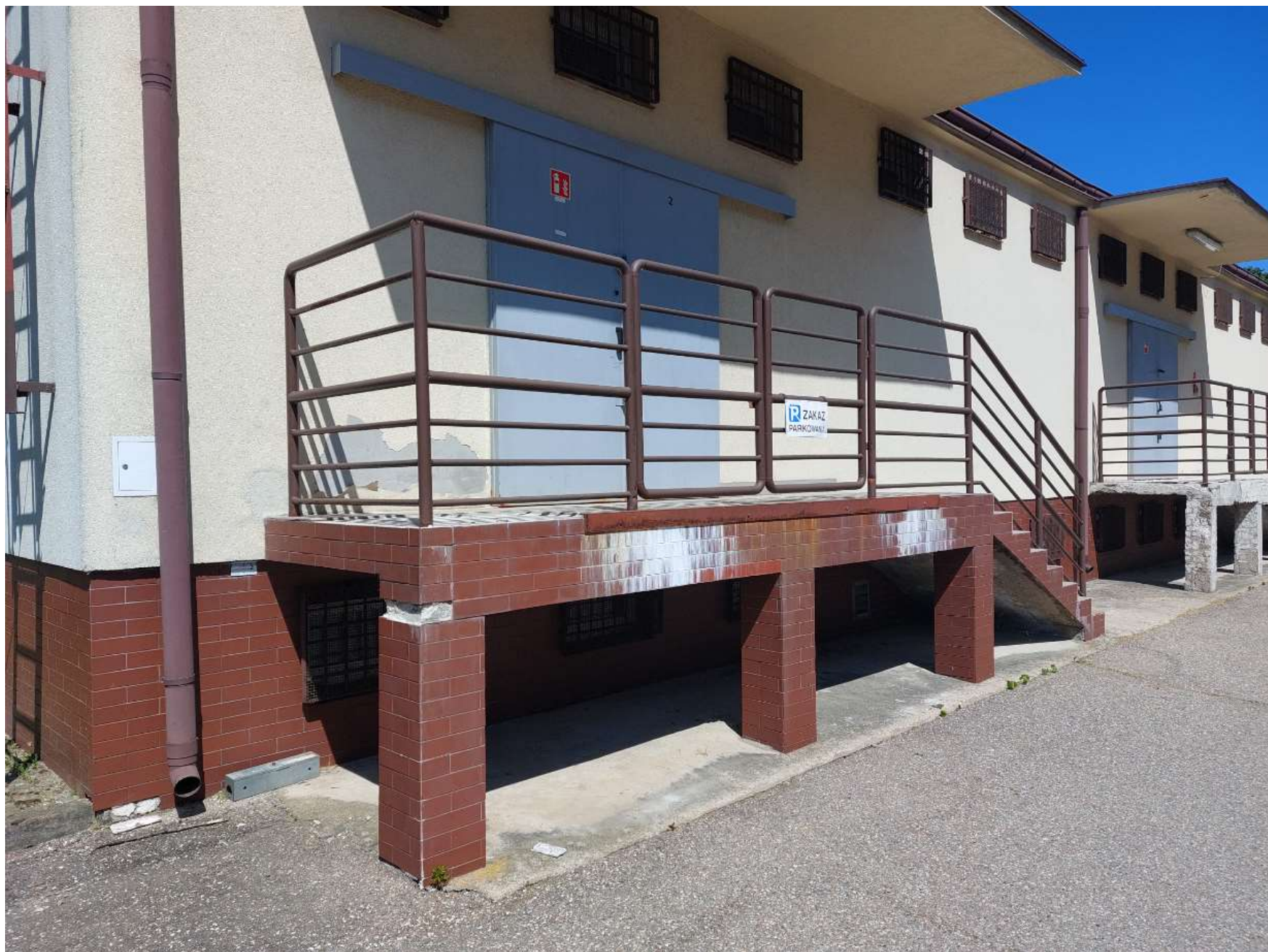
Zdjęcie nr 1: Rampa rozładunkowa i schody nr 1 (stan istniejący) – widok na rampę