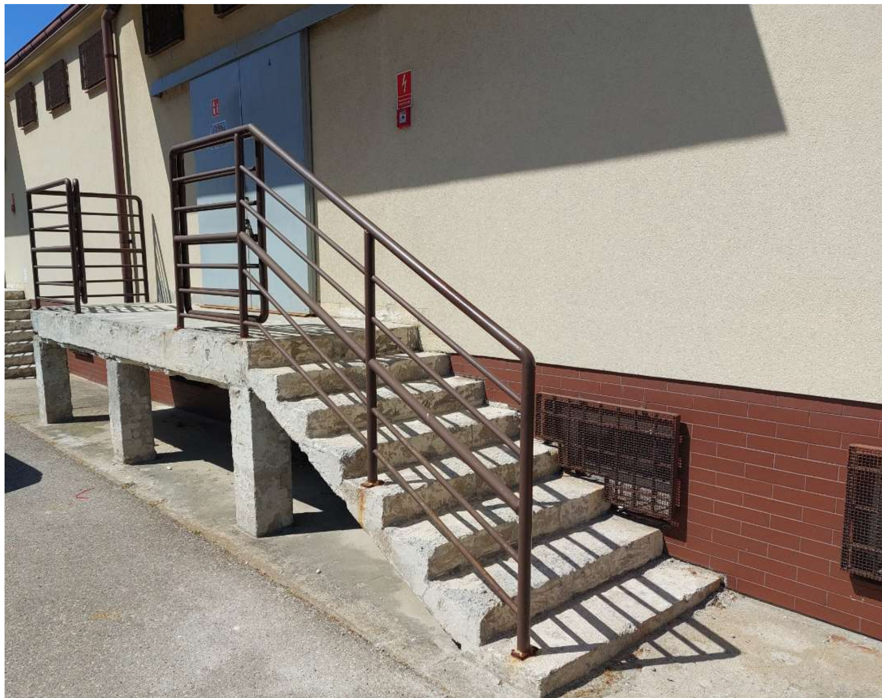
Zdjęcie nr 6: Rampa rozładunkowa i schody nr 3 (stan istniejący) – widok na schody