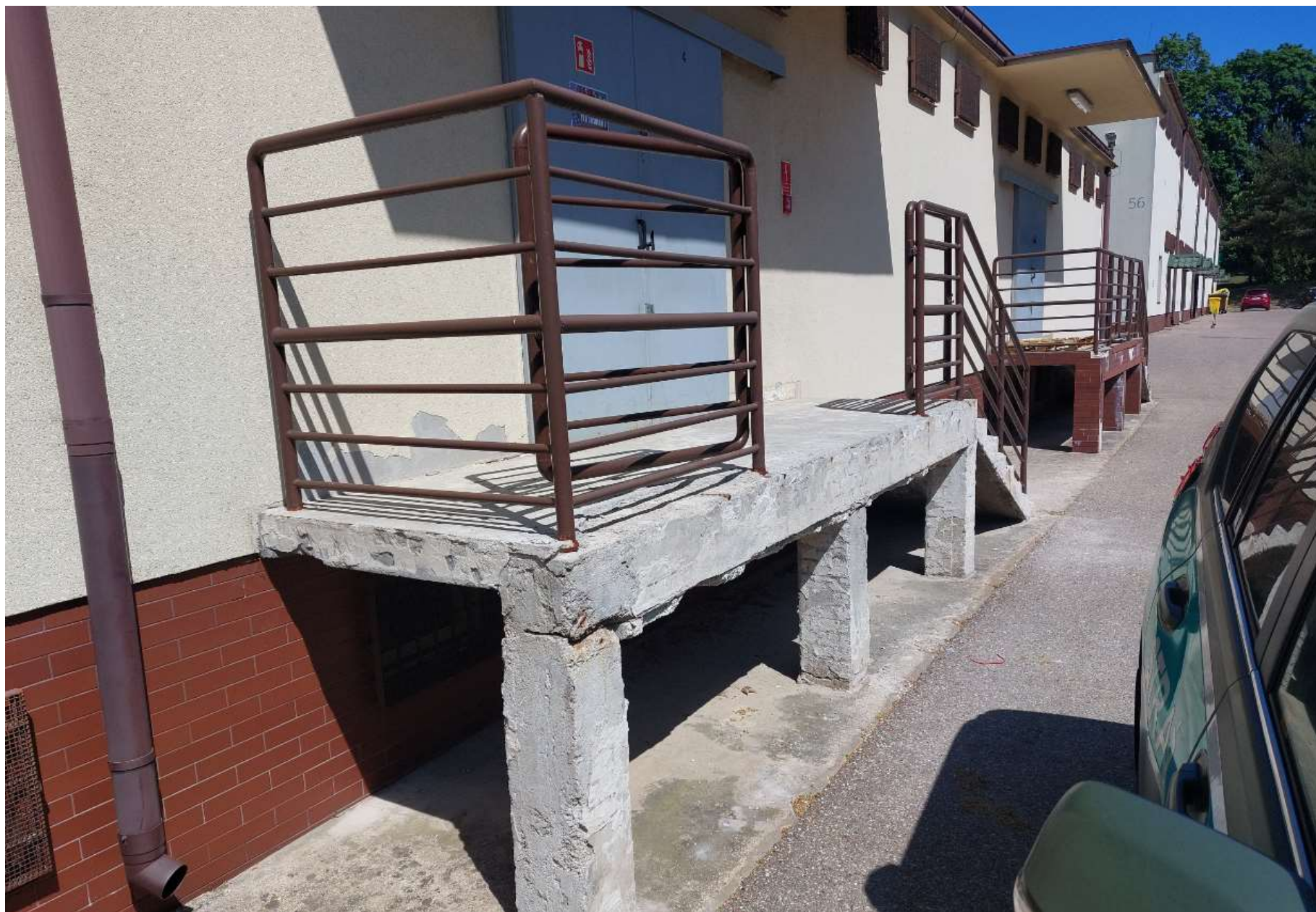
Zdjęcie nr 5: Rampa rozładunkowa i schody nr 3 (stan istniejący) – widok na rampę