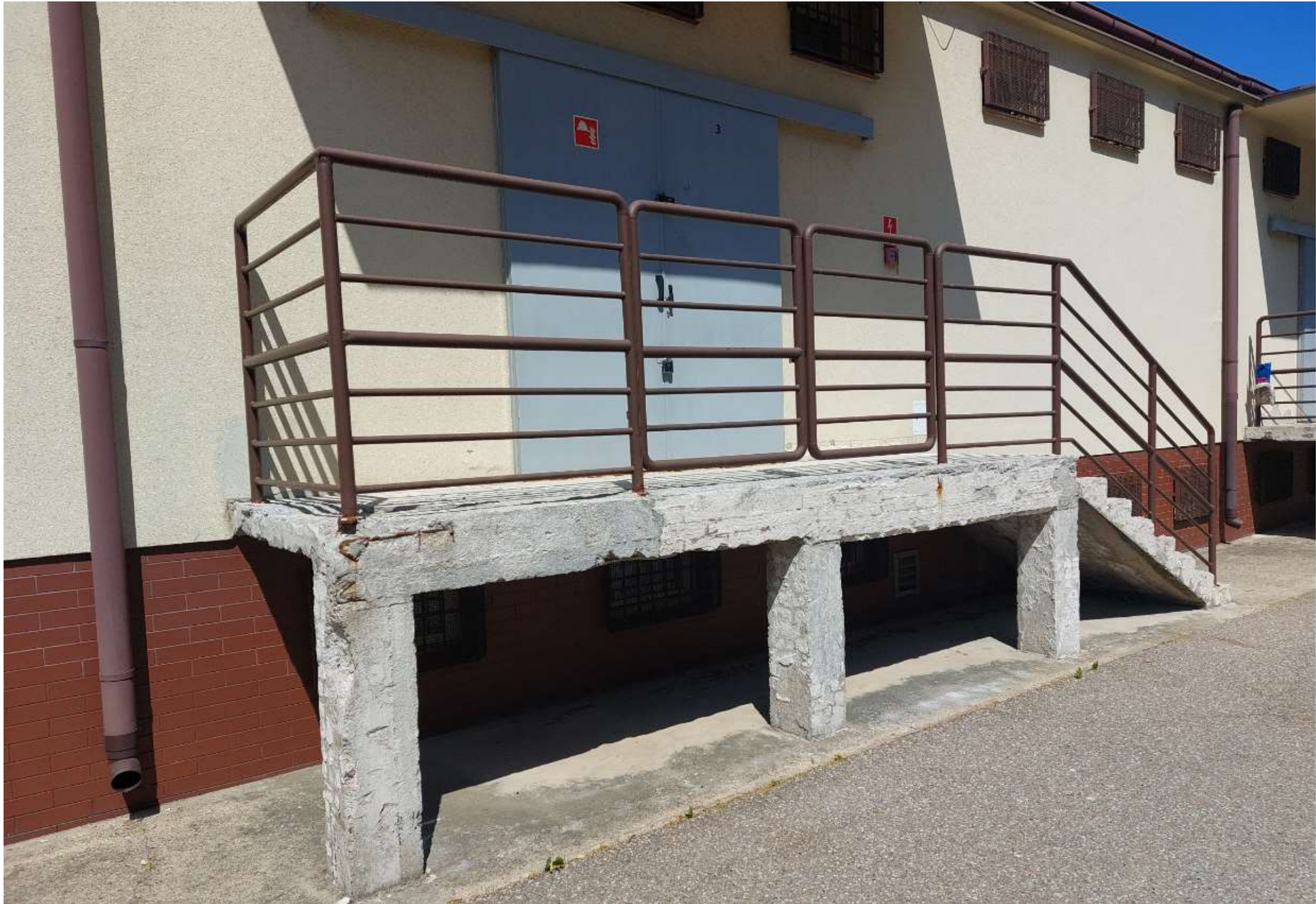
Zdjęcie nr 3: Rampa rozładunkowa i schody nr 2 (stan istniejący) – widok na rampę