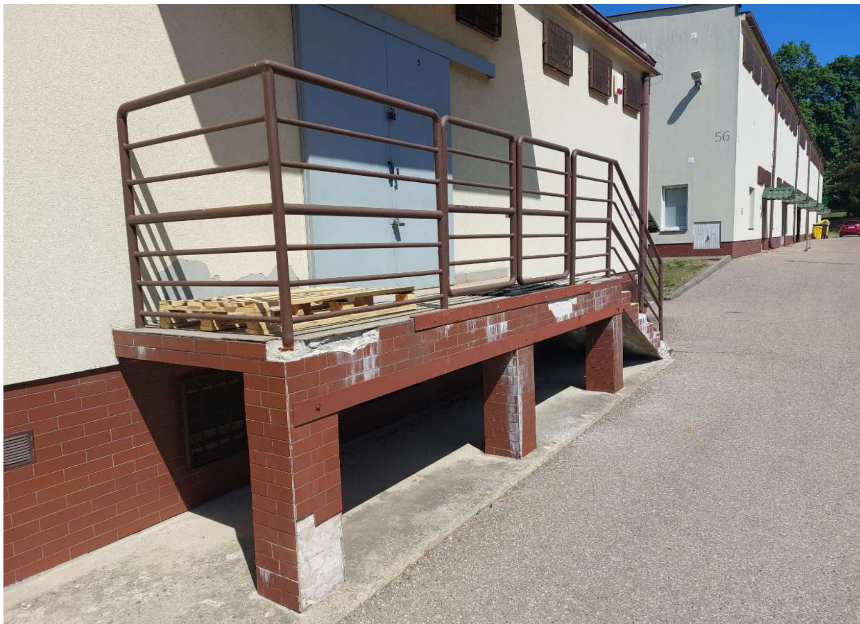
Zdjęcie nr 7: Rampa rozładunkowa i schody nr 4 (stan istniejący) – widok na rampę