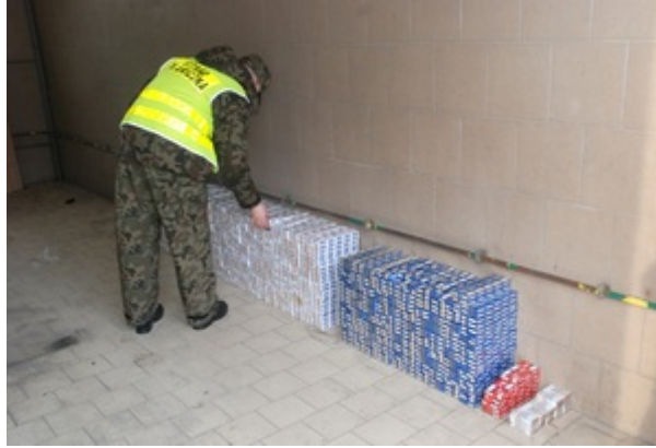
Papierosy o wartości blisko 45 tys. zł.