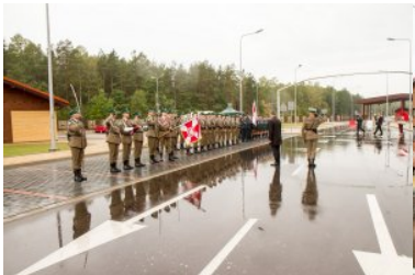
Uroczyste przekazanie nowo wybudowanych obiektów w dpq w Połowcach