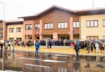
Uroczyste przekazanie nowo wybudowanych obiektów w dpq w Połowcach