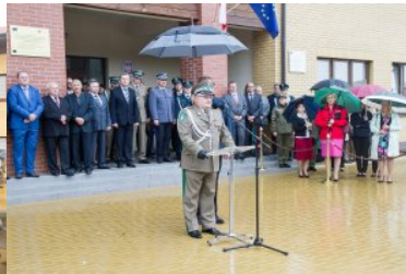
Uroczyste przekazanie nowo wybudowanych obiektów w dpq w Połowcach