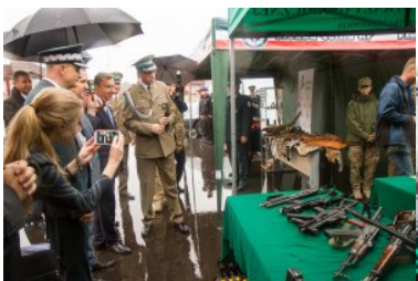
Uroczyste przekazanie nowo wybudowanych obiektów w dpq w Połowcach