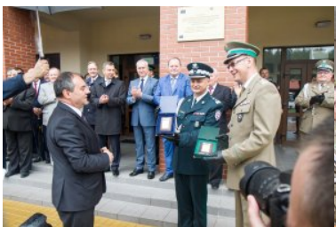
Uroczyste przekazanie nowo wybudowanych obiektów w dpq w Połowcach