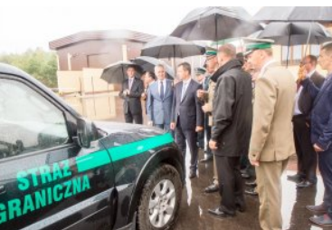
Uroczyste przekazanie nowo wybudowanych obiektów w dpq w Połowcach