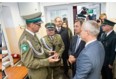
Uroczyste przekazanie nowo wybudowanych obiektów w dpq w Połowcach