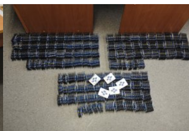
Ujawnione nielegalne farmaceutyki