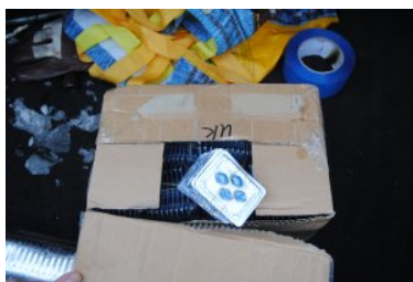
Ujawnione nielegalne farmaceutyki

25 - letni mężczyzna usłyszał zarzuty z art. 124 Ustawy Prawo farmaceutyczne. Za wprowadzanie do obrotu lub przechowywanie w celu wprowadzenia do obrotu produktów leczniczych, nie posiadając na to pozwolenia, grozi mu grzywna, kara ograniczenia wolności albo pozbawienia wolności do lat 2. Zatrzymanego obywatela Litwy wraz z nielegalnymi tabletkami oraz dokumentacją przekazano Policji w Sejnach. Pojazd o szacunkowej wartości 13 tys. zł został zatrzymany jako dowód w sprawie.