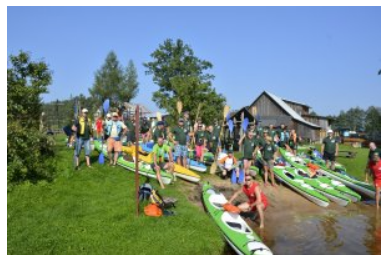
XV Międzynarodowy Splyw Kajakowy Służb Granicznych