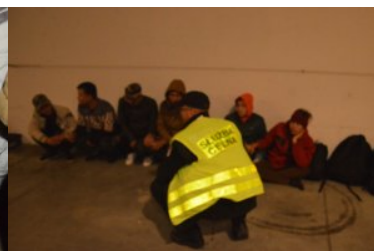
Zatrzymani obywatele Wietnamu