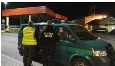
Wspólny patrol z zatrzymanymi obywatelami Wietnamu

Obecnie zatrzymani cudzoziemcy pozostają w dyspozycji placówki Straży Granicznej w Rutce Tartak. Dalsze losy obcokrajowców rozstrzygną się po wyjaśnieniu okoliczności ich przybycia do Polski. Najprawdopodobniej zostaną przekazani stronie litewskiej w ramach readmisji. Łotewski kierowca i jego zmiennik zostali zatrzymani za zorganizowanie nielegalnego przekroczenia granicy.