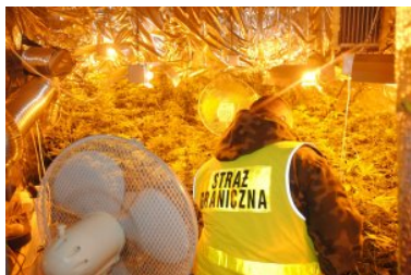
Ujawnione sadzonki marihuany

Do nielegalnej plantacji i substancji narkotycznych przyznał się 28 - letni właściciel posesji. Po wykonaniu czynności wyjaśniających zatrzymanego obywatela Polski wraz z dokumentacją i zabezpieczonymi dowodami w sprawie przekazano Policji w Sejnach.