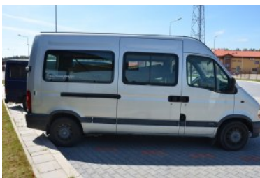
Zatrzymane auto z przemytem

Wobec kierowcy funkcjonariusze Służby Celno-Skarbowej wszczęli sprawę karną skarbową rekwirując nielegalny towar oraz samochód przystosowany do przewozu kontrabandy. Oprócz grożącej kary grzywny przemytnik decyzją Komendanta Placówki Straży Granicznej w Czeremsze otrzymał zakaz wjazdu na terytorium Unii Europejskiej na 3 lata.