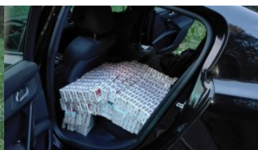
Auto wypełnione nielegalnymi papierosami