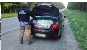
Auto wypełnione nielegalnymi papierosami