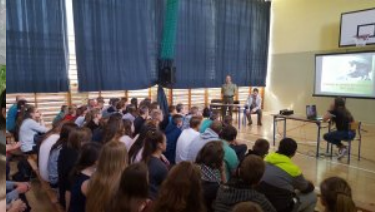
Spotkania z uczniami szkół powiatu suwalskiego