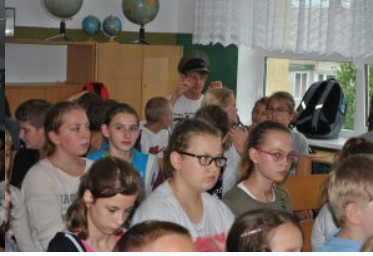
Spotkania z uczniami szkół powiatu suwalskiego