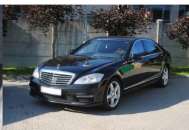
Auto, w którym ukryta była kontrabanda