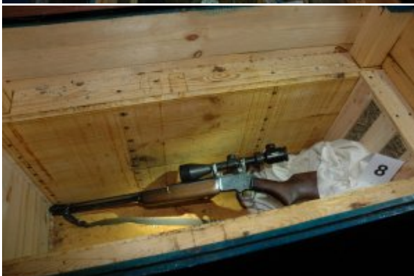
Ujawniona broń, tłumiki i amunicja