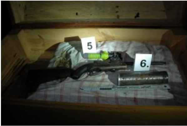
Ujawniona broń, tłumiki i amunicja