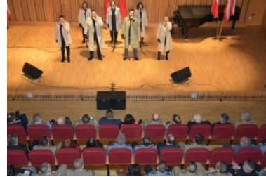
Suwalskie obchody Dnia Pamięci Żołnierzy Wyklętych