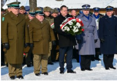
Suwalskie obchody Dnia Pamięci Żołnierzy Wyklętych