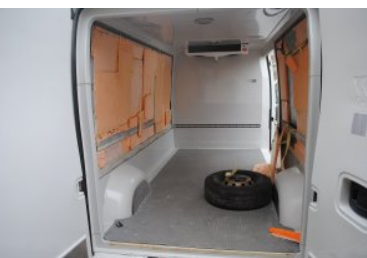
Papierosy ukryte w busie