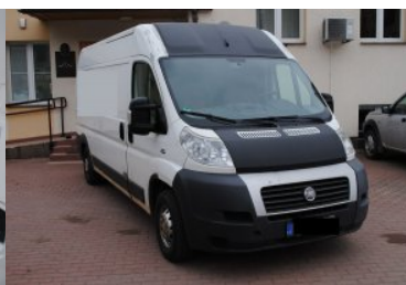
Papierosy ukryte w busie