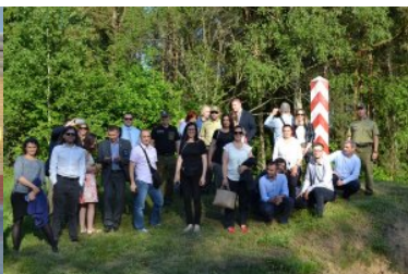
Wizyta przedstawicieli państw regionu Bałkanów Zachodnich