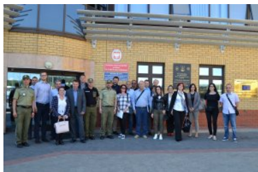
Wizyta przedstawicieli państw regionu Bałkanów Zachodnich