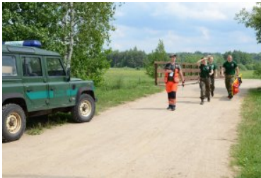
III Otwarte Mistrzostwa Podlaskiego Oddziału SG w Kwalifikowanej Pomocy Przedmedycznej

Zawody odbyły się pod patronatem Komendanta Podlaskiego Oddziału Straży Granicznej. Zostały zorganizowane przez Służbę Zdrowia przy Podlaskim Oddziale SG. Współorganizatorem było Stowarzyszenie „Łączy nas granica” oraz Regionalna Dyrekcja Lasów Państwowych.