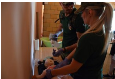
III Otwarte Mistrzostwa Podlaskiego Oddziału SG w Kwalifikowanej Pomocy Przedmedycznej