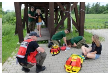
III Otwarte Mistrzostwa Podlaskiego Oddziału SG w Kwalifikowanej Pomocy Przedmedycznej