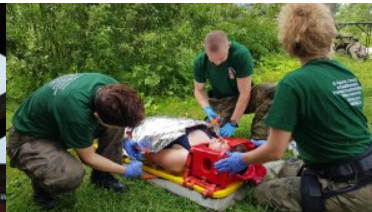
III Otwarte Mistrzostwa w Kwalifikowanej Pomocy Przedmedycznej Straży Granicznej