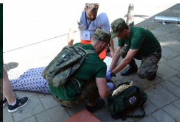
III Otwarte Mistrzostwa Podlaskiego Oddziału SG w Kwalifikowanej Pomocy Przedmedycznej