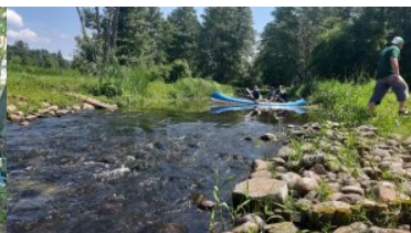
III Otwarte Mistrzostwa Podlaskiego Oddziału SG w Kwalifikowanej Pomocy Przedmedycznej