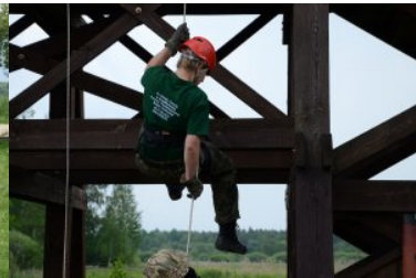
III Otwarte Mistrzostwa Podlaskiego Oddziału SG w Kwalifikowanej Pomocy Przedmedycznej