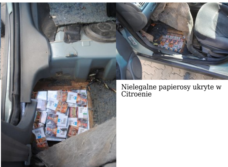
Nielegalne papierosy ukryte w Citroenie