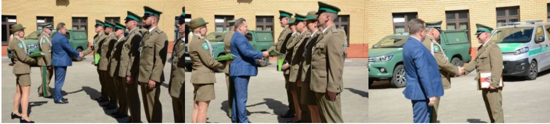
Uroczysty apel w PSG w Kuźnicy