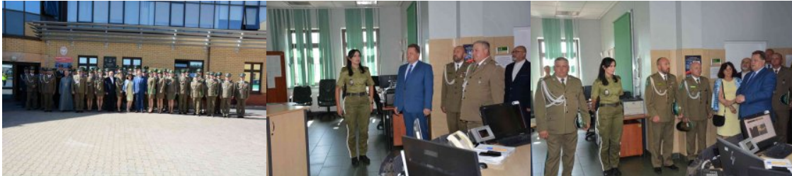
Uroczysty apel w PSG w Kuźnicy