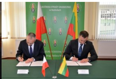
Konferencja Głównych Pełnomocników Granicznych Polski i Litwy