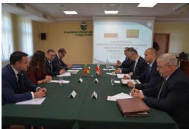
Konferencja Głównych Pełnomocników Granicznych Polski i Litwy