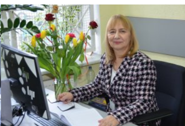
Kobiety w służbie