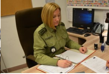
Kobiety w służbie