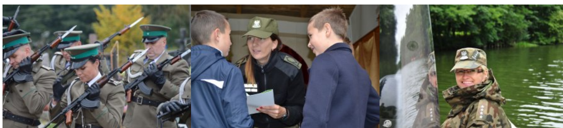
Kobiety w służbie

W Podlaskim Oddziale Straży Granicznej spośród 286 pracowników cywilnych zatrudnionych jest także 175 pań. Na co dzień wspomagają służbę funkcjonariuszy. Pracują głównie w pionie finansowym, logistycznym, dbają o kwestie kadrowe.