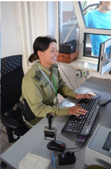
Kobiety w służbie