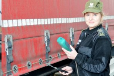
Kobiety w służbie