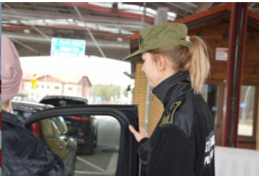
Kobiety w służbie