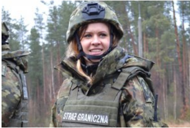
Kobiety w służbie