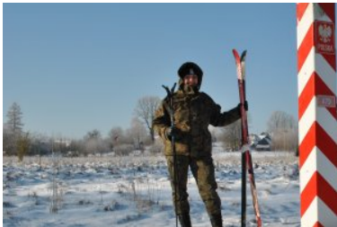
Kobiety w służbie