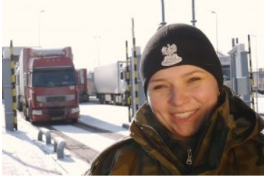
Kobiety w służbie