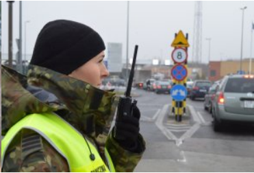
Kobiety w służbie