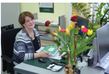
Kobiety w służbie