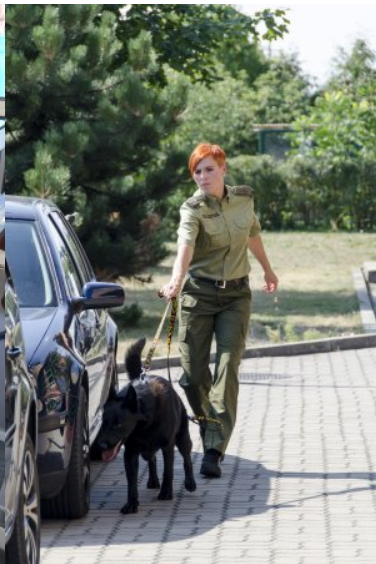
Kobiety w służbie