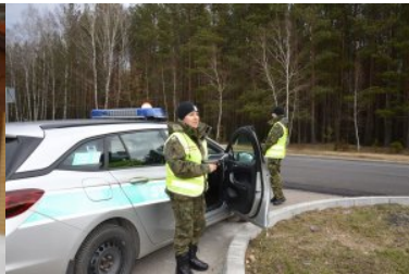
Kobiety w służbie