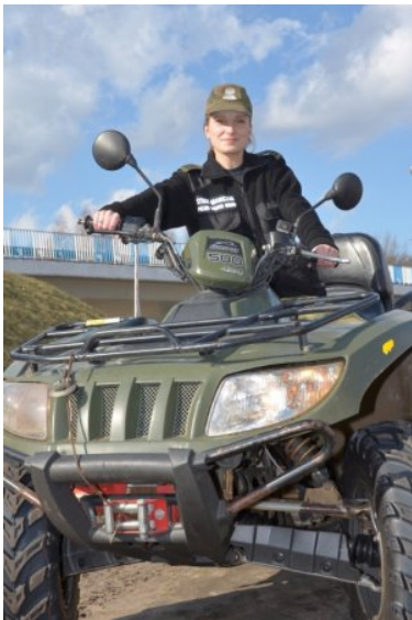
Kobiety w służbie