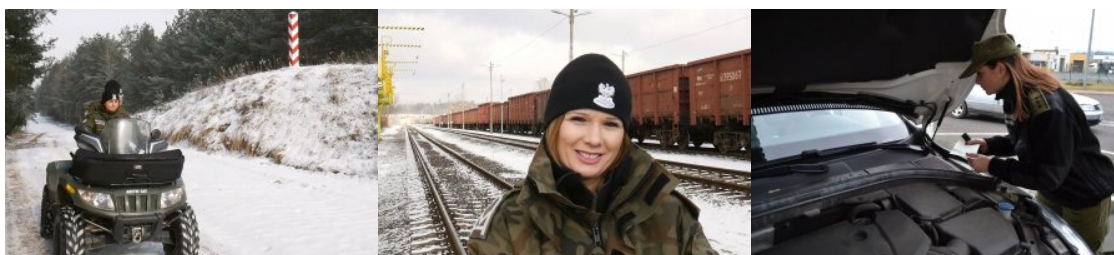
Kobiety w służbie