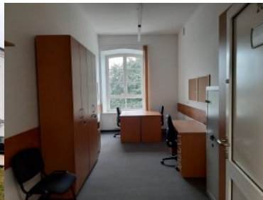
Wyremontowany budynek numer dwa