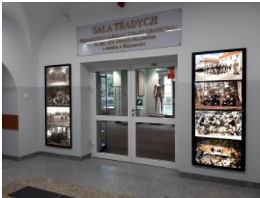
Wyremontowany budynek numer dwa