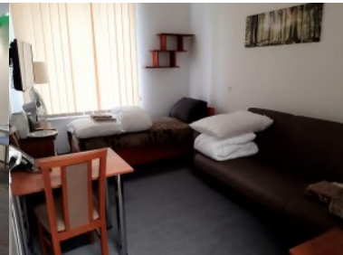
Wyremontowany budynek numer dwa