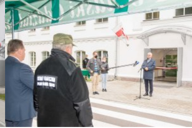
Uroczyste oddanie do użytku budynku nr 2