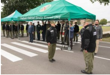
Uroczyste oddanie do użytku budynku nr 2