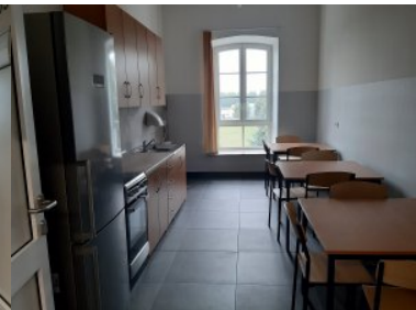
Wyremontowany budynek numer dwa