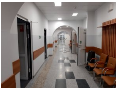
Wyremontowany budynek numer dwa