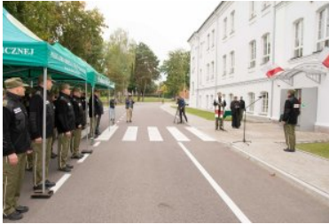
Uroczyste oddanie do użytku budynku nr 2