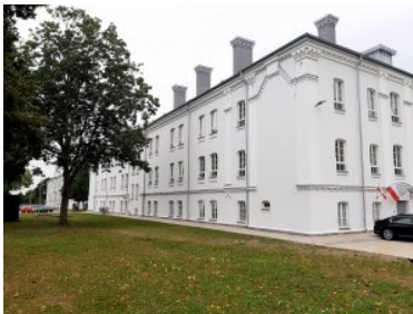
Wyremontowany budynek numer dwa