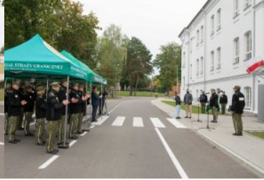
Uroczyste oddanie do użytku budynku nr 2