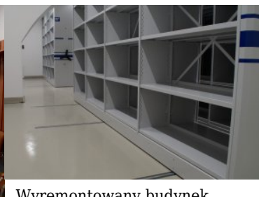
Wyremontowany budynek numer dwa