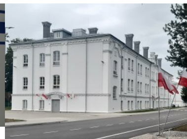
Wyremontowany budynek numer dwa