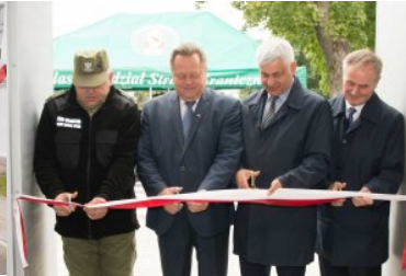
Uroczyste oddanie do użytku budynku nr 2