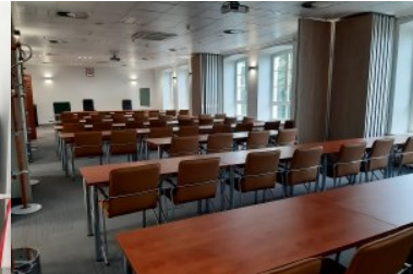
Wyremontowany budynek numer dwa