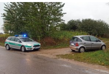
Papierosy ukryte w podwójnej podłodze