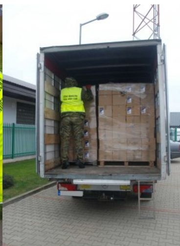
Zabezpieczono papierosy bez akcyzy warte 140 tys. zł