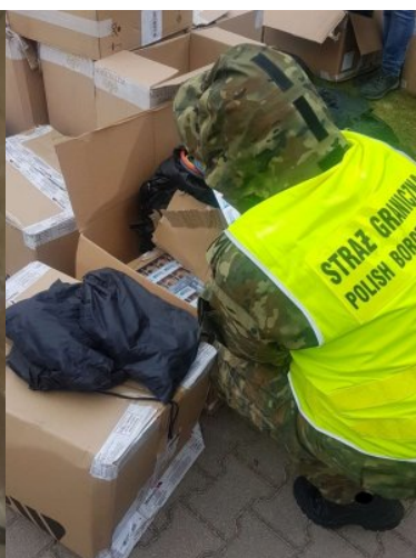
Zabezpieczono papierosy bez akcyzy warte 140 tys. zł