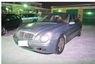
Papierosowa kontrabanda ukryta w Mercedesie

Funkcjonariusze Straży Granicznej wszczęli postępowanie w sprawie naruszenia przez obywatela Polski przepisów kodeksu karnego skarbowego. Mężczyźnie grozi kara wysokiej grzywny.