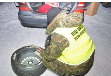
Papierosowa kontrabanda ukryta w Mercedesie