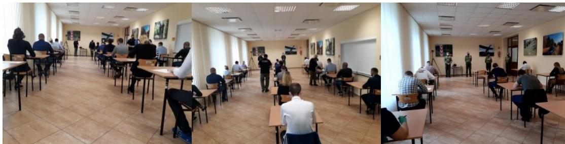
Kandydaci do służby podczas II etapu rekrutacji

Wszelkie informacje dotyczące rekrutacji można znaleźć na stronie internetowej Podlaskiego Oddziału Straży Granicznej w zakładce nabór .