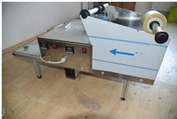
Zabezpieczone maszyny do produkcji papierosów