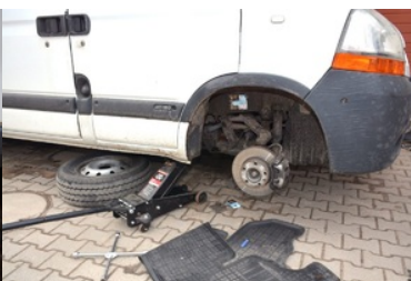
Ujawnione skrytki z nielegalnymi papierosami