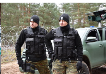
Straż Graniczna (8)