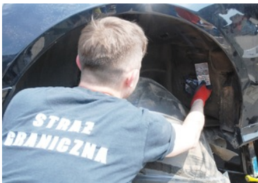
Ujawnione nielegalne papierosy

Od początku 2022 roku funkcjonariusze Podlaskiego Oddziału Straży Granicznej ujawnili przemyt papierosów o wartości ponad 5,3 mln zł.