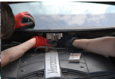
Ujawnione nielegalne papierosy