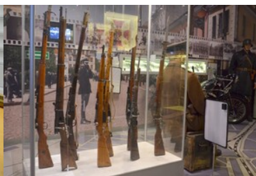
Warsztaty z identyfikacji zabytkowej broni i amunicji