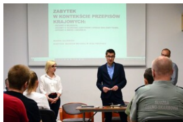
Warsztaty z identyfikacji zabytkowej broni i amunicji

Nabyte umiejętności praktyczne oraz wiedza teoretyczna przyczynią się do podniesienia kwalifikacji funkcjonariuszy realizujących zadania z zakresu zwalczania przestępczości.