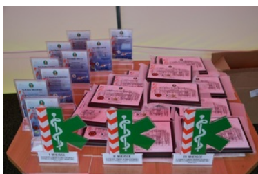
IV Zawody w Kwalifikowanej Pomocy Przedmedycznej Podlaskiego Oddziału Straży Granicznej