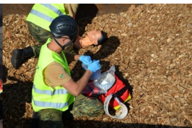
IV Zawody w Kwalifikowanej Pomocy Przedmedycznej Podlaskiego Oddziału Straży Granicznej