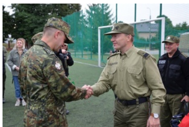
IV Zawody w Kwalifikowanej Pomocy Przedmedycznej Podlaskiego Oddziału Straży Granicznej