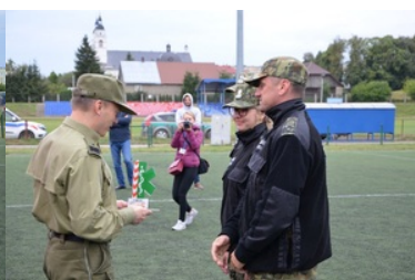
IV Zawody w Kwalifikowanej Pomocy Przedmedycznej Podlaskiego Oddziału Straży Granicznej