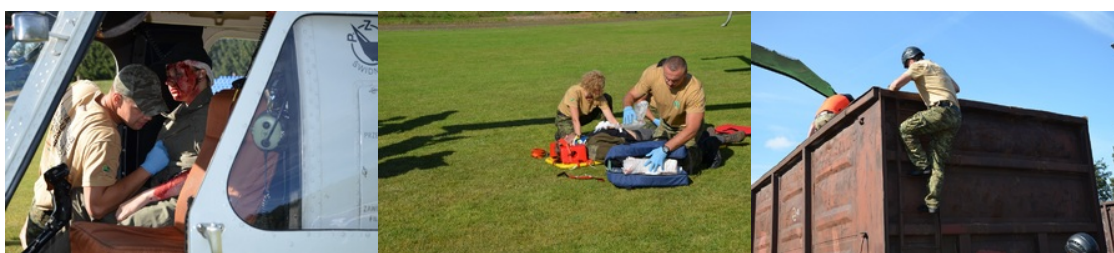
IV Zawody w Kwalifikowanej