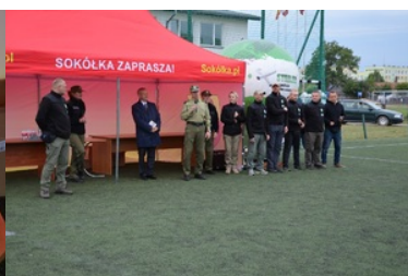
IV Zawody w Kwalifikowanej Pomocy Przedmedycznej Podlaskiego Oddziału Straży Granicznej