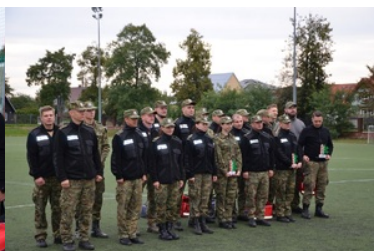
IV Zawody w Kwalifikowanej Pomocy Przedmedycznej Podlaskiego Oddziału Straży Granicznej