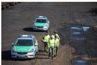
IV Zawody w Kwalifikowanej Pomocy Przedmedycznej Podlaskiego Oddziału Straży Granicznej