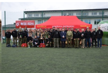
IV Zawody w Kwalifikowanej Pomocy Przedmedycznej Podlaskiego Oddziału Straży Granicznej