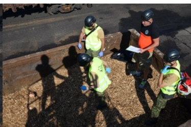
IV Zawody w Kwalifikowanej Pomocy Przedmedycznej Podlaskiego Oddziału Straży Granicznej