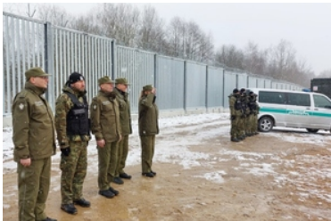
Wizyta na terenie Podlaskiego Oddziału SG w związku z zakończeniem prac przy pierwszym odcinku bariery elektronicznej na granicy polsko-białoruskiej