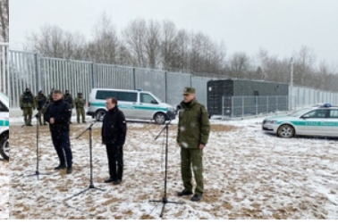
Wizyta na terenie Podlaskiego Oddziału SG w związku z zakończeniem prac przy pierwszym odcinku bariery elektronicznej na granicy polsko-białoruskiej