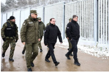
Wizyta na terenie Podlaskiego Oddziału SG w związku z zakończeniem prac przy pierwszym odcinku bariery elektronicznej na granicy polsko-białoruskiej