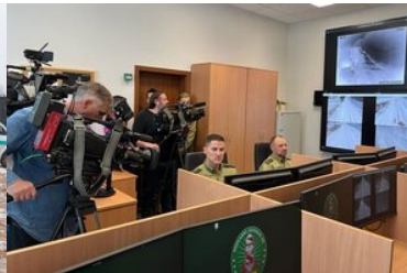
Centrum Nadzoru w Białymstoku