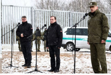
Wizyta na terenie Podlaskiego Oddziału SG w związku z zakończeniem prac przy pierwszym odcinku bariery elektronicznej na granicy polsko-białoruskiej