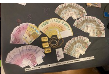
Ujawnione środki pieniężne podczas przeszukania