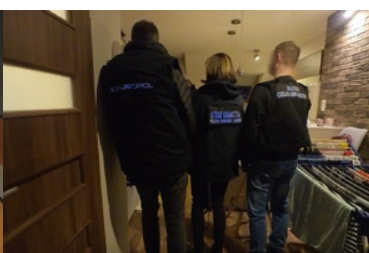
Przeszukanie jednej z lokalizacji