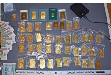
Ujawnione złoto w trakcie przeszukania