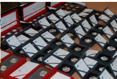
Ujawnione monety w trakcie przeszukania