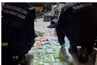
Ujawnione środki pieniężne podczas przeszukania