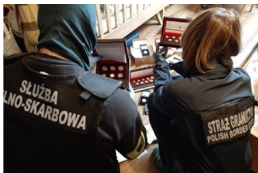
Ujawnione monety w trakcie przeszukania

O sprawie opowiadają oficerowie operacyjni z Podlaskiego Oddziału Straży Granicznej