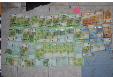
Ujawnione środki pieniężne podczas przeszukania