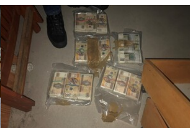
Ujawnione środki pieniężne podczas przeszukania