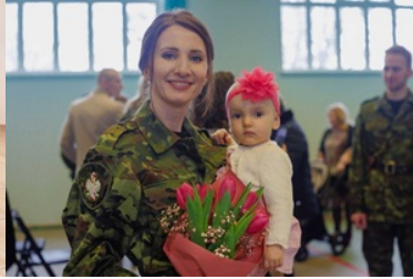
Panie w Podlaskim Oddziale Straży Granicznej