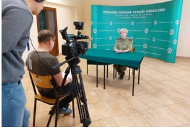
Panie w Podlaskim Oddziale Straży Granicznej