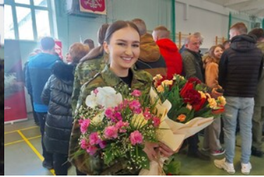
Panie w Podlaskim Oddziale Straży Granicznej