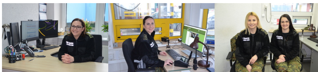
Panie w Podlaskim Oddziale