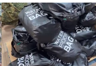
Otrzymane pakiety pomocowe z Caritas Polska