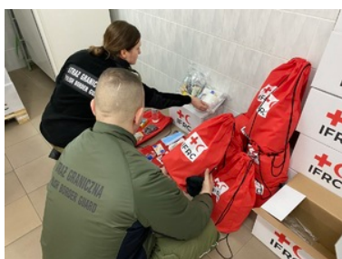
Otrzymane pakiety pomocowe z Polskiego Czerwonego Krzyża