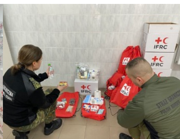
Otrzymane pakiety pomocowe z Polskiego Czerwonego Krzyża