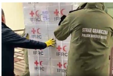
Otrzymane pakiety pomocowe z Polskiego Czerwonego Krzyża

Za wszystkie przekazane dary serdecznie dziękujemy!