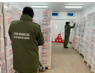
Otrzymane pakiety pomocowe z Polskiego Czerwonego Krzyża