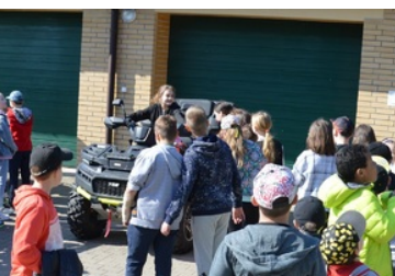
Dzieci zapoznają się z pojazdami służbowymi