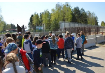
Dzieci zwiedzają drogowe przejście graniczne w Połowcach