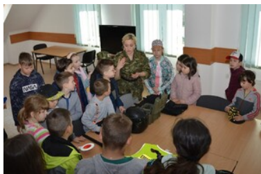
Dzieci poznają sprzęt służbowy Straży Granicznej