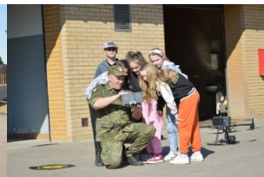
Dzieci poznają sprzęt służbowy Straży Granicznej