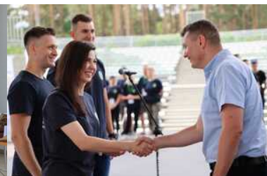
Mistrzostwa w Kwalifikowanej Pierwszej Pomocy