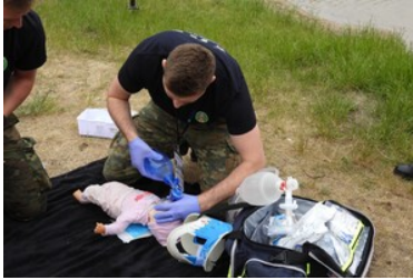
Mistrzostwa w Kwalifikowanej Pierwszej Pomocy