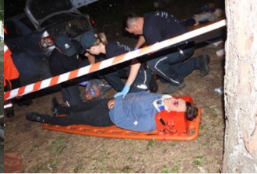
Mistrzostwa w Kwalifikowanej Pierwszej Pomocy