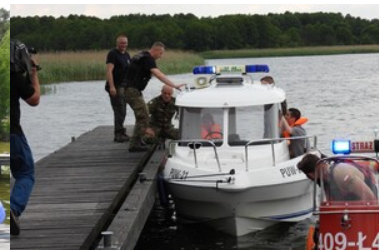
Mistrzostwa w Kwalifikowanej Pierwszej Pomocy