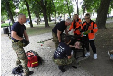
Mistrzostwa w Kwalifikowanej Pierwszej Pomocy