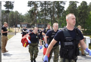
Mistrzostwa w Kwalifikowanej Pierwszej Pomocy