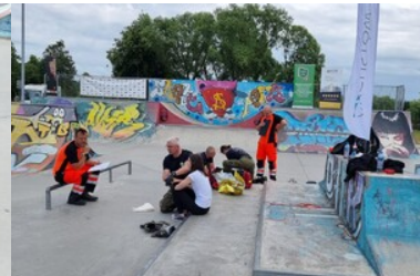
Mistrzostwa w Kwalifikowanej Pierwszej Pomocy