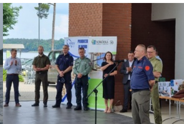
Mistrzostwa w Kwalifikowanej Pierwszej Pomocy