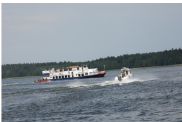
Mistrzostwa w Kwalifikowanej Pierwszej Pomocy