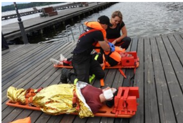
Mistrzostwa w Kwalifikowanej Pierwszej Pomocy