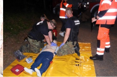
Mistrzostwa w Kwalifikowanej Pierwszej Pomocy