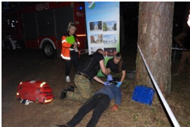
Mistrzostwa w Kwalifikowanej Pierwszej Pomocy