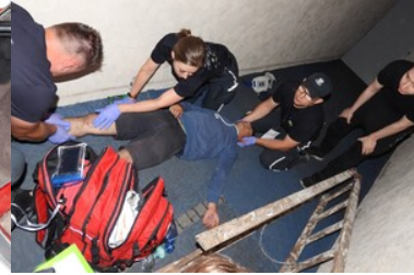
Mistrzostwa w Kwalifikowanej Pierwszej Pomocy