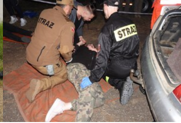
Mistrzostwa w Kwalifikowanej Pierwszej Pomocy