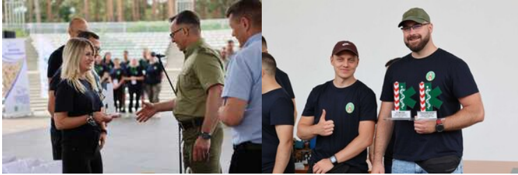
Mistrzostwa w Kwalifikowanej Pierwszej Pomocy