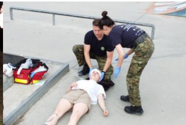
Mistrzostwa w Kwalifikowanej Pierwszej Pomocy