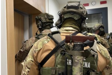
Funkcjonariusze Straży Granicznej