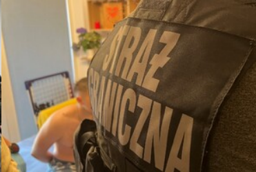
Zatrzymany obywatel Ukrainy