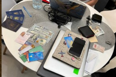
Zabezpieczone przedmioty podczas przeszukania