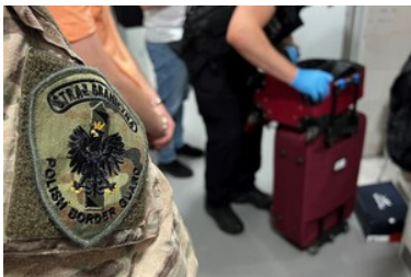
Przeszukanie miejsca zamieszkania obywatela Ukrainy