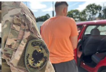
Zatrzymany obywatel Ukrainy