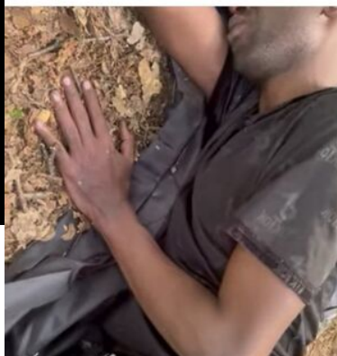
Obywatel Somalii w relacji aktywistów

Chłopak nieoficjalnie podobno został wyrzucony. straż graniczna Dubicze cerkiewne . patrzcie. W jakim stanie był chłopak. Chłopak nie był w stanie się poruszać. Osłabiony. Podobno lekarz z karetki stwierdził dobry stan chłopaka. Dyżurny sg Dubicze cerkiewne kieruje do rzeczniczki. domyślam się że go zawrócili na Białoruś. Tak działa nasze państwo . Miejmy nadzieje jednak zw maja chłopaka w placówce.