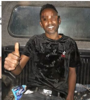
Obywatel Somali w aucie Straży Granicznej kilkanaście minut później