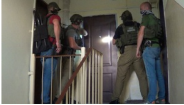
Zatrzymanie obywatela Gruzji za organizowanie nielegalnej migracji