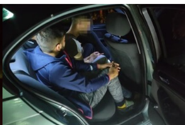
Zatrzymanie kuriera przewożącego migrantów