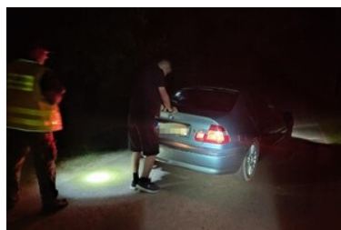
Zatrzymanie kuriera przewożącego migrantów

47 - letni obywatel Azerbejdżanu usłyszał zarzuty organizowania nielegalnego przekroczenia granicy, grozi mu do 8 lat pozbawienia wolności.