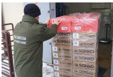
Otrzymane artykuły z Polskiego Czerwonego Krzyża

Polski Czerwony Krzyż wspiera humanitarną sieć działającą przy Podlaskim Oddziale SG od początku trwania kryzysu migracyjnego (jesień 2021 r.) na granicy polsko-białoruskiej. W ramach podpisanego porozumienia PCK, Stowarzyszenia Łączy nas Granica i Podlaskiego Oddziału Straży Granicznej wielokrotnie byliśmy wspierani darami humanitarnymi, za które serdecznie dziękujemy!