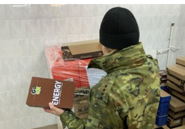
Otrzymane artykuły z Polskiego Czerwonego Krzyża