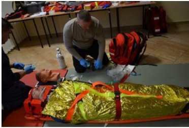
Szkolenie grup poszukiwawczo ratowniczych