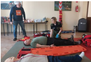
Szkolenie grup poszukiwawczo ratowniczych