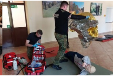
Szkolenie grup poszukiwawczo ratowniczych