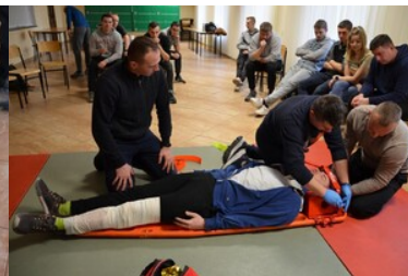
Szkolenie grup poszukiwawczo ratowniczych