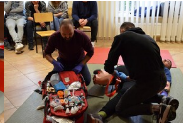
Szkolenie grup poszukiwawczo ratowniczych