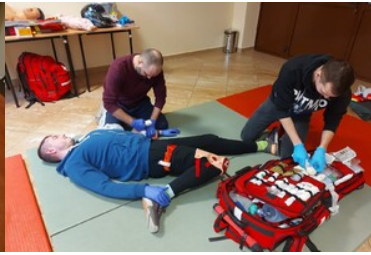
Szkolenie grup poszukiwawczo ratowniczych