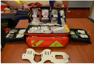
Szkolenie grup poszukiwawczo ratowniczych

pierwszej pomocy zostało przeszkolonych ponad 1200 osób. Wprowadzono również cykl szkoleń z pomocy w hipotermii, na których przeszkolono ponad 1000 osób.