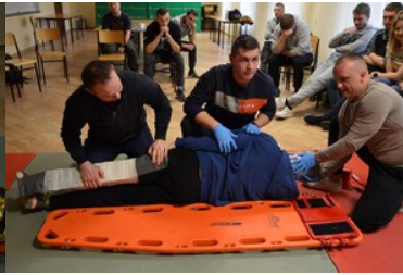
Szkolenie grup poszukiwawczo ratowniczych