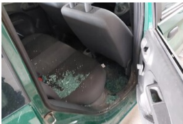
Wybita szyba w samochodzie SG

Od początku 2024r. na odcinku granicy państwowej ochranianym przez Podlaski Oddział Straży Granicznej zatrzymano 97 pomocników i organizatorów nielegalnego przekroczenia granicy.