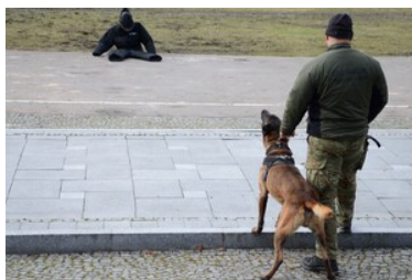
Pies służbowy POSG

Kynolodzy Straży Granicznej podkreślają, że to nie rasa, ale predyspozycje danego zwierzęcia są najważniejsze. Stąd w naszej formacji są pojedynczy przedstawiciele niektórych ras m.in. terier walijski, jack russel terier, parson russel terier, chodsky pes, płochacz niemiecki, jagdterrier.